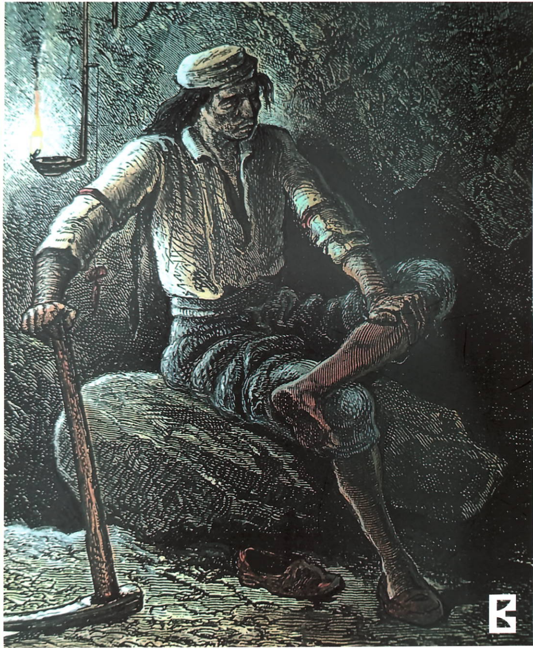
Minero nativo de Cerro Pasco